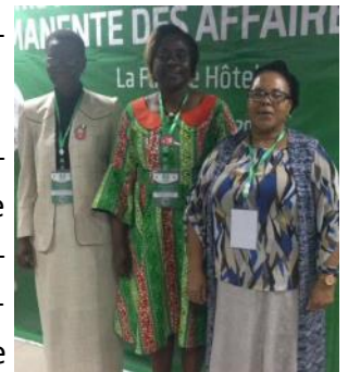
Groupe de Travail des Femmes de la CPAA

La Commission Permanente des Femmes de la Fédération Mondiale des Anciens Combattants (CPF) considère que la participation des femmes aux processus de paix en tant que civils, militaires et citoyennes dans les pays en conflit ou en guerre est bienvenue et nécessaire pour de plus grand progrès. La CPF applaudit toute initiative visant à parvenir à la parité entre les sexes, tient compte de la problématique hommes-femmes et veille à ce que les hommes et les femmes soient traités et affectés de manière équitable tant au sein des missions que dans les régions où ces missions sont menées.